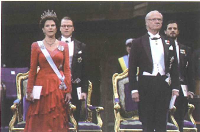
Los Reyes Carlos Gustavo XVI y Silvia de Suecia a su llegada al Palacio de Congresos de Estocolmo.